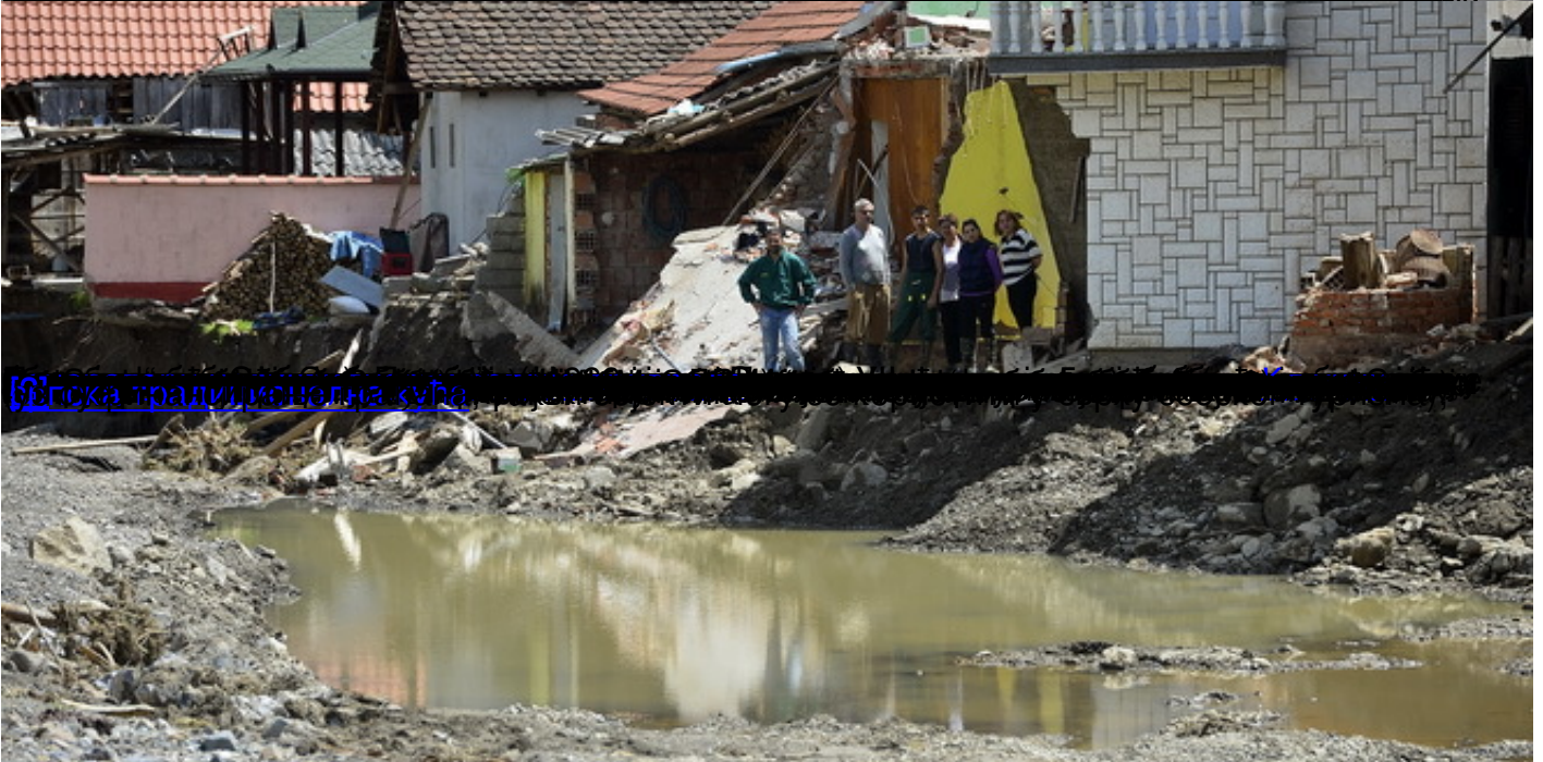
Бугска традиционална кућа