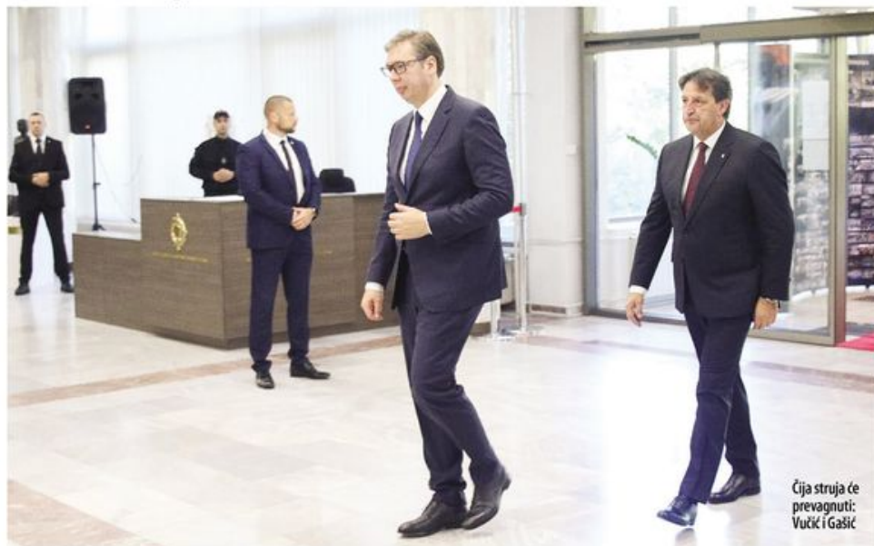
Čija struja će prevagnuti: Vučić i Gašić