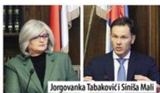
Jorgovanka Tabaković i Siniša Mali

TEMA: Zašto je ponovo produžen rok za formiranje nove Vlade Srbije do samog „foto-finiša“