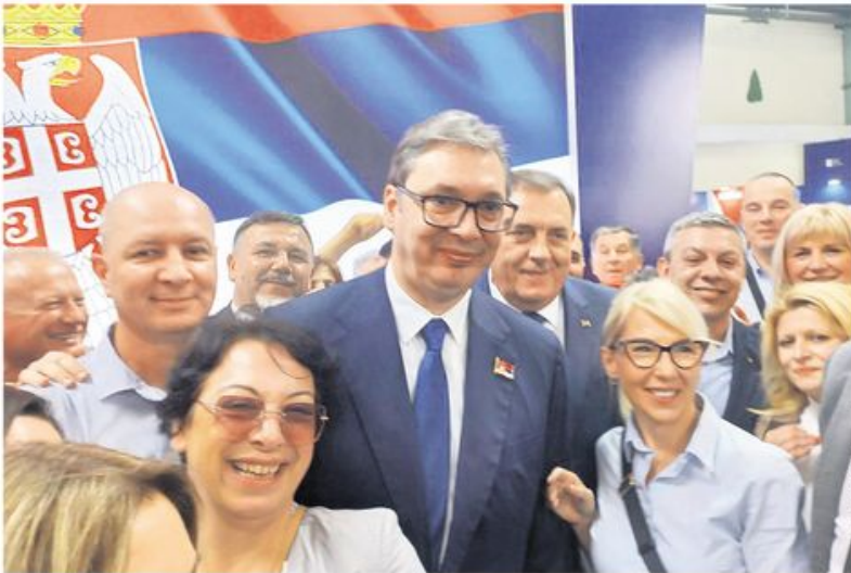
Председник Србије на Међународном сајму привреде у Мостару