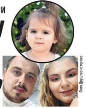
странице 14. и 15.