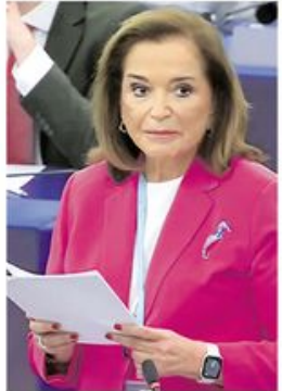
БАКОЈАНИЈЕВА ПРЕПОРУЧИЛА ПРИЈЕМ ТЗВ. КОСОВА У СЕ