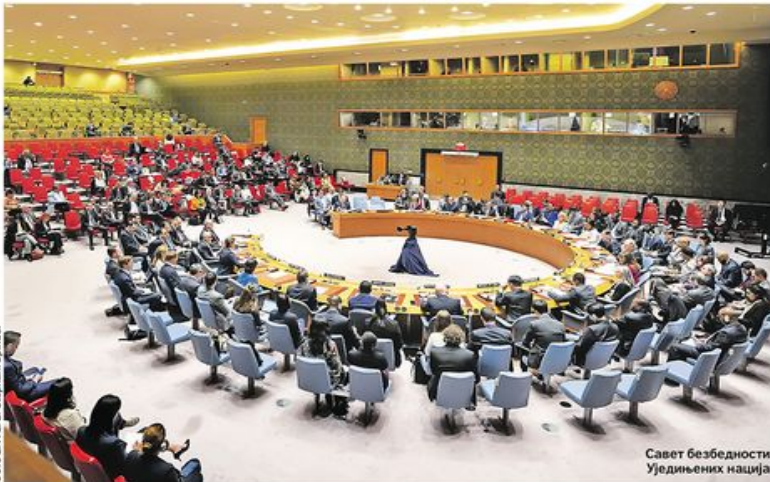
Савет безбедности Уједињених нација