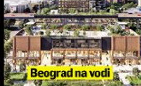
Beograd na vodi