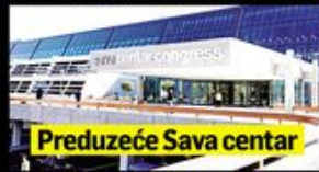
Preduzeće Sava centar