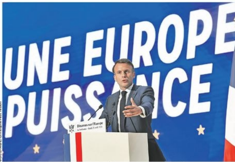
Медијски садржаји које гледају деца и адолесценти у ЕУ све више су „амерички и азијски“: француски председник