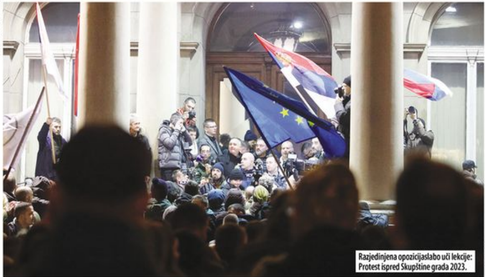
Razjedinjena opozicijaslabo uči lekcije: Protest ispred Skupštine grada 2023.