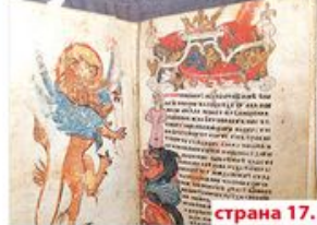
Фото Галерија Рима