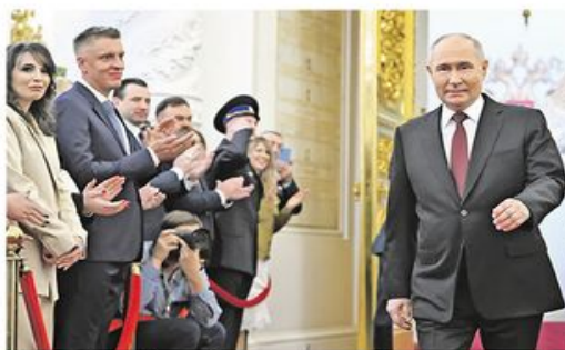
Свечаност у Великој палати Кремља

Владимир Путин јуче је званично започео пети мандат на положају председника Руске Федерације након полагања заклетве у Великој палати Кремља. Он ће на функцији остати наредних шест година, до 2030. године, преноси РИА Новости. Путин је на председничким изборима у Русији, одржаним од 15. до 17. марта, освојио 87,28 одсто гласова.