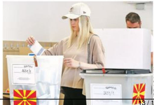
Гласање у Скопљу за председника државе и Собрание