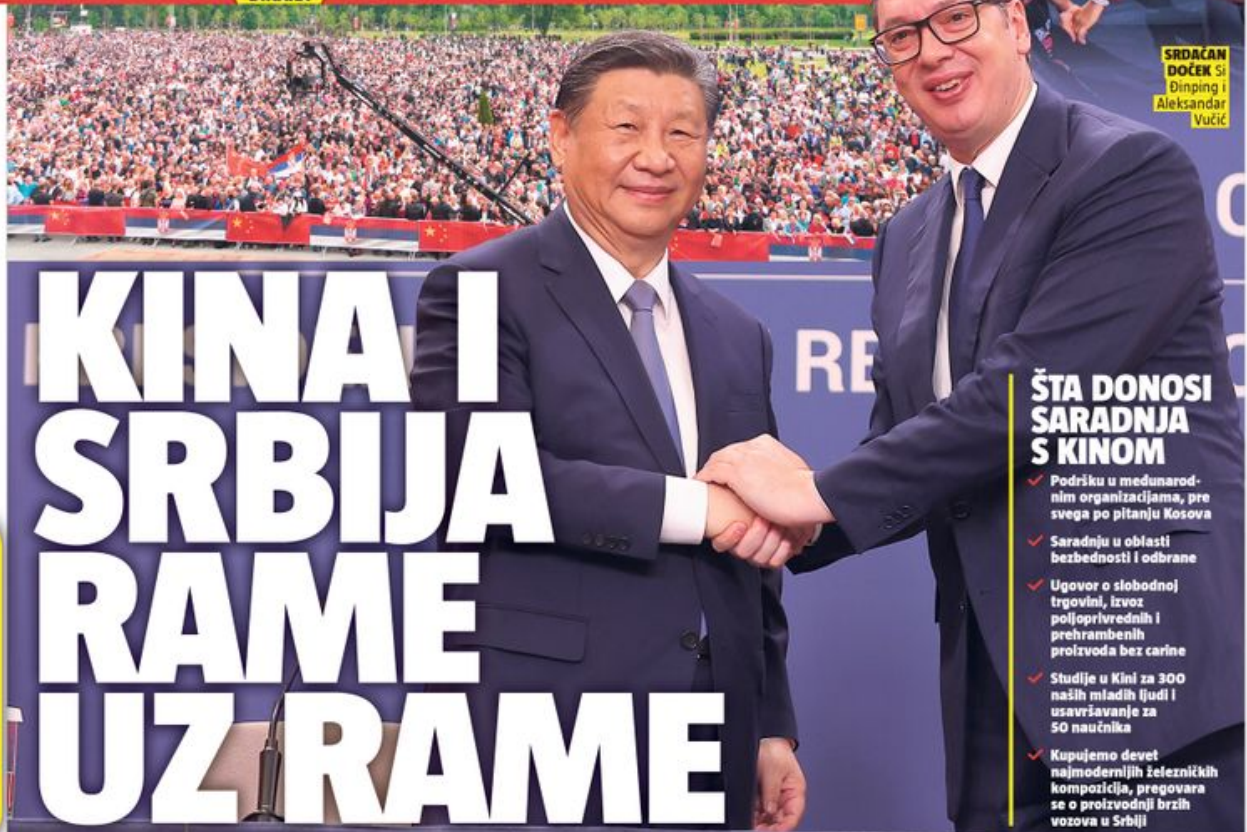
SRDAČAN DOČEK Si Dinping i Aleksandar Vučić

Broj 3669 / 40 dinara / Republika Srpska 1 KM / Crna Gora 0,7 EUR