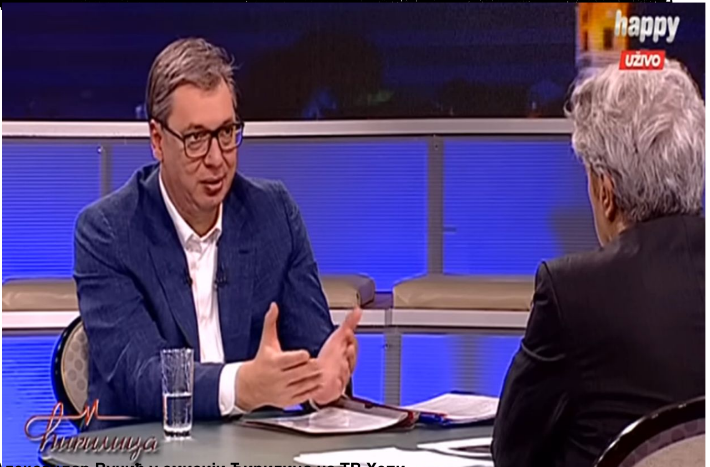
Александар Вучић у емисији Тирлица на ТВ Хеви