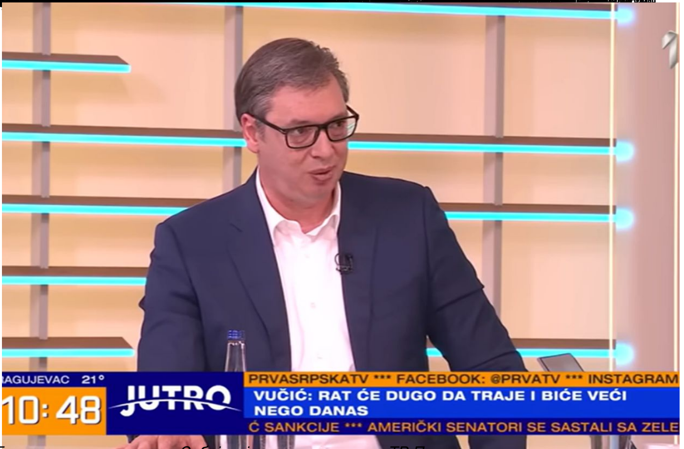
Гостовање председника Србије у јутарњем програму ТВ Прва