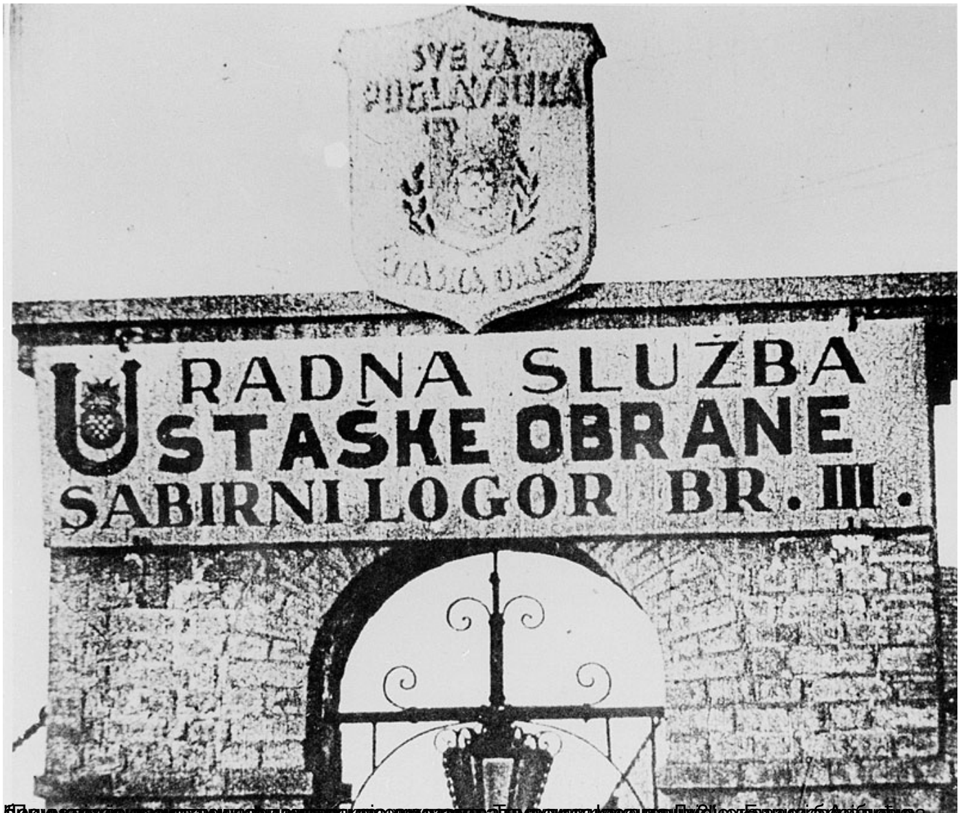
Београд, 1945. Улица у којој се налазило Уставско одбрамбено одељење у Београду, Београд.