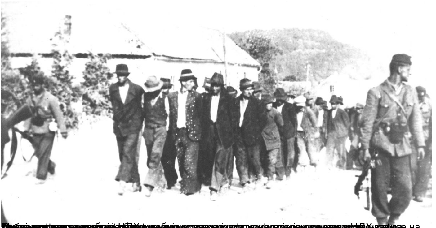
Дан сећања на жртве геноцида над Србима, Јеврејима и Ромима у НДХ. Патријарх Порфирије: До