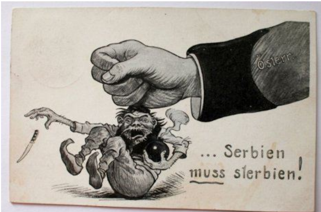
Видео: Слободан Антонић / Видео: Слободан Антонић

Пише: Слободан Антонић недеља, 08 септембар 2019 12:57