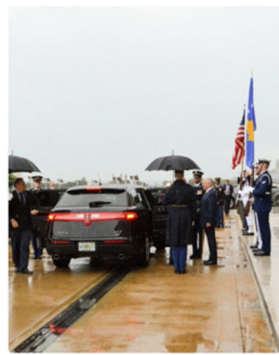
1:34 PM - 28 Sep 2018

Ramush Haradinaj @haradinajramush A great honor to meet @DeSecDef James Mattis at the... Delighted to receive his will... support #Kosovo in strengt... institutions and to further d... #US strategic military & pol... 🇰🇲 🇺🇸