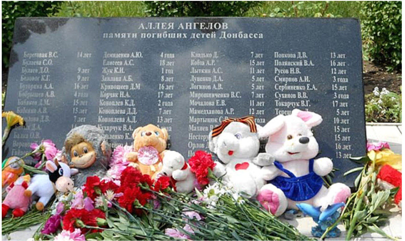
Алеја анђела на гробљу у Доњецку

Морамо, нажалост, да констатујемо да супротна страна на Западу изгубила осећај за реалност, прешли су све границе. А није требало.