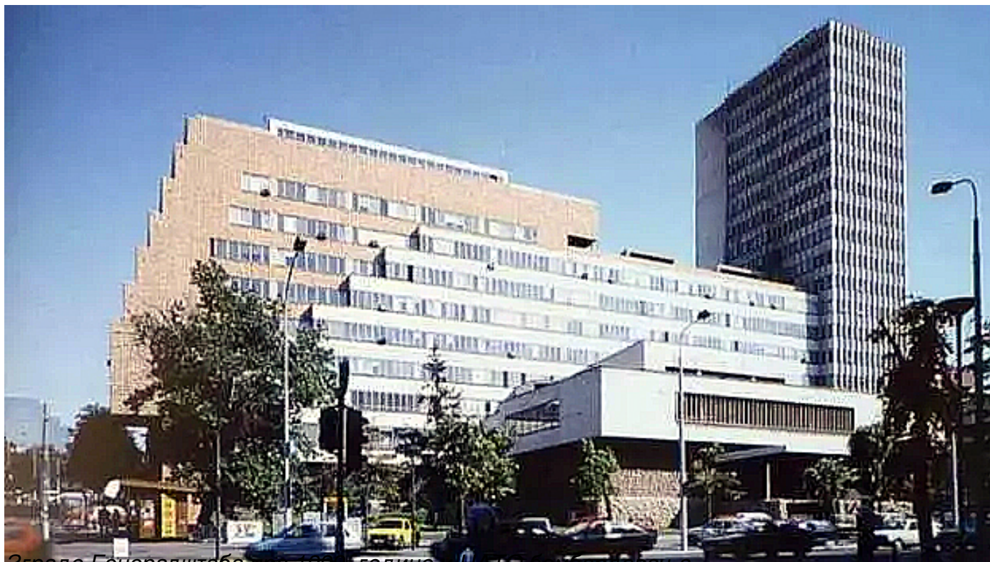
Зграде Генералштаба пре 1999. године и НАТО бомбардовања

Пише: Душко Кузовић понедељак, 25 март 2024 22:33