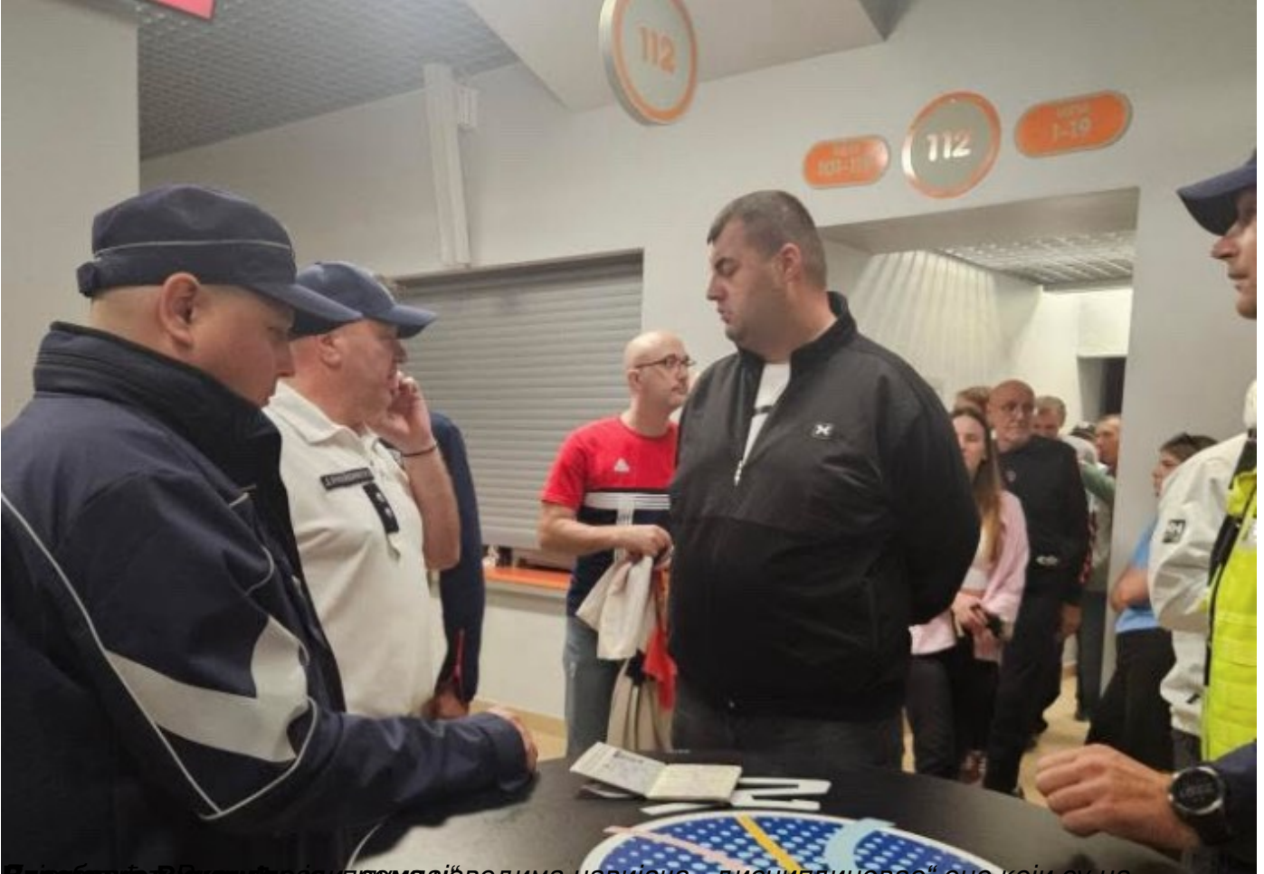
Бродови у Београду су у процесу мајај водима навијача, „дисциплиновао“ оне који су на