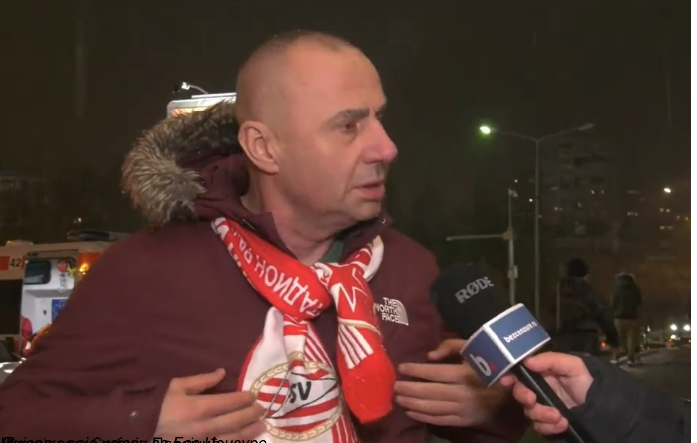
Чувари партије и „Нациленда“