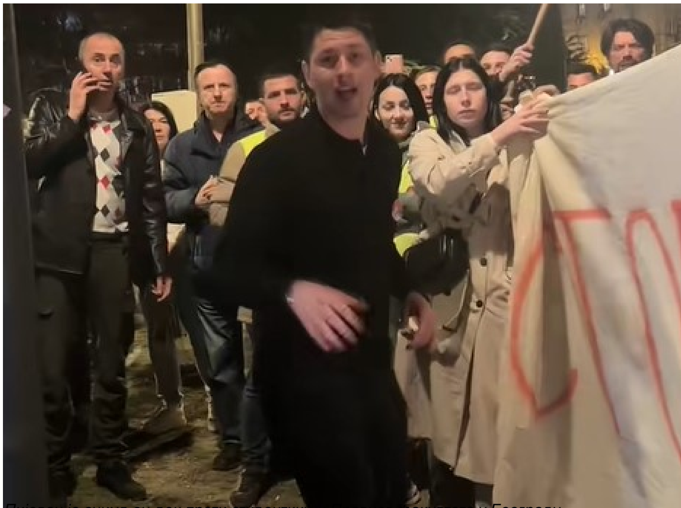
Пијевац је снимљен док прети студенткињи Правног факултета у Београду