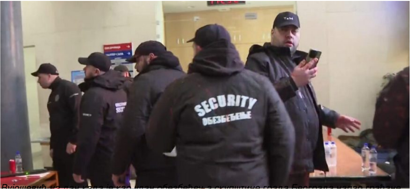
Вјештачи из ове партије као и из обезбјеђења окупационе групе Београда изврше грабеж