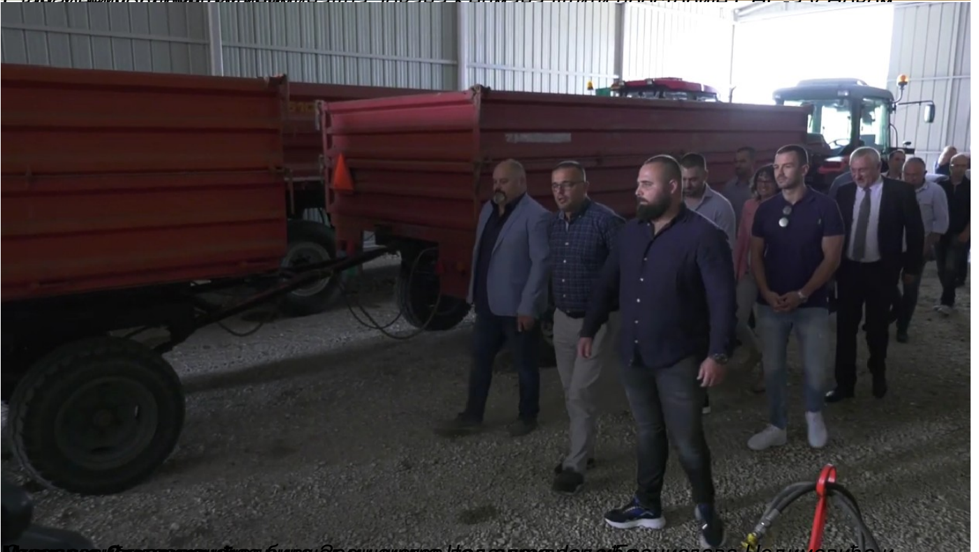
изградње у Старицима код Бивша Брњацког Неподдржавајућег Јанислава Недимовића и