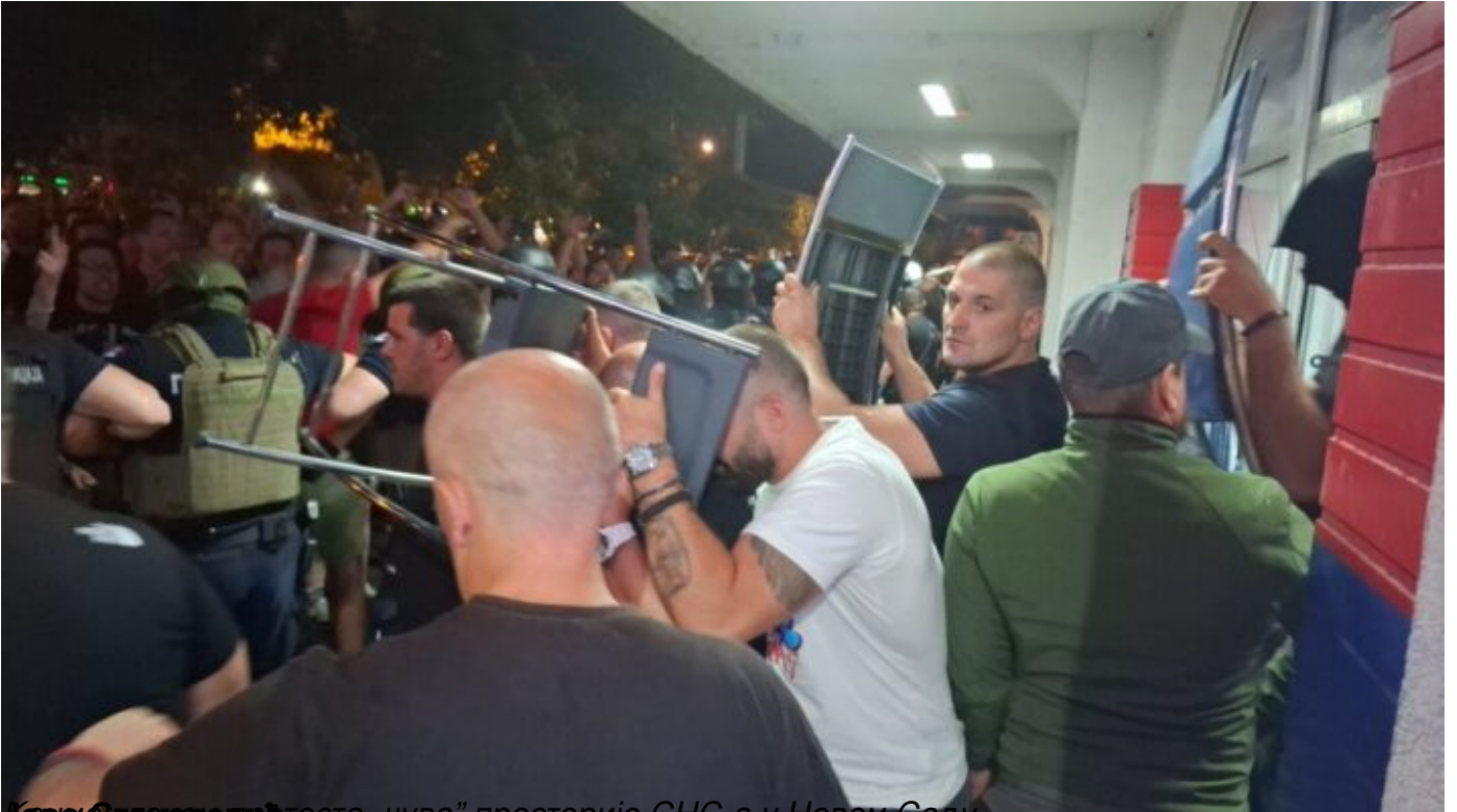
Чувари партије „Пациленда“ у просторије СНС-а у Новом Саду