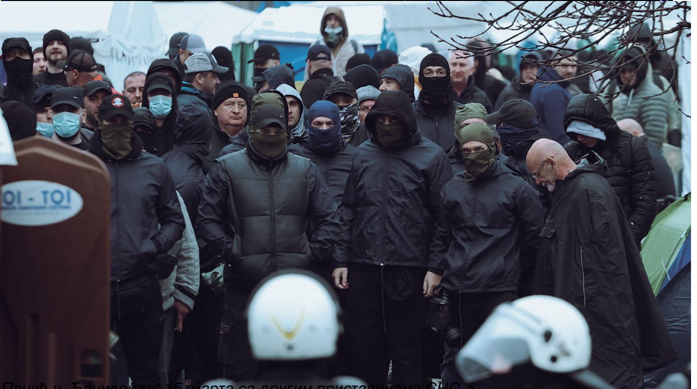
Панић у „Гациленду“ 15. марта са другим присталицама СНС-а