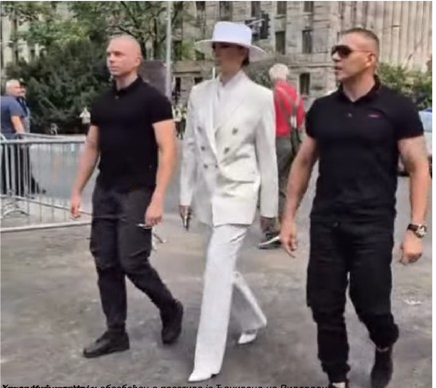
Уредница новинарских обезбеђења посетила је Тациленд на Видовдан