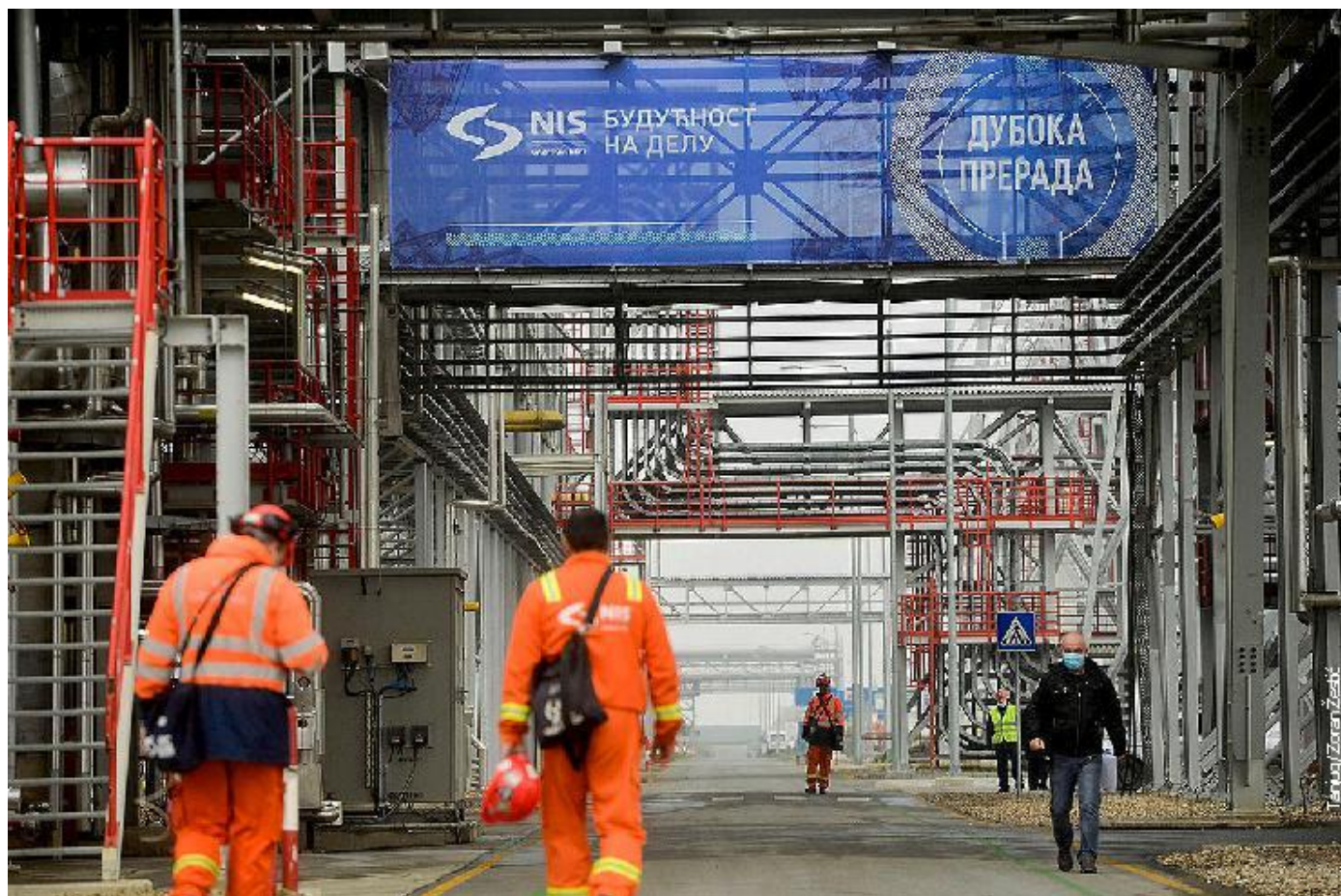
Рафинерија у Панчеву

Прошле године, када су најављене санкције НИС-у, национализација, по речима председника Александра Вучића, није била опција. Сада је – последња опција. Ту опцију су на ванредној седници Владе у недељу на сто ставили министарка енергетике Дубравка Ђедовић Хандановић и министар финансија Сениша Мали. Председник републике изјаснио се против. С друге стране, Руси су најавили да су коначно спремни да продају свој удео у НИС-у. Али ко год био купац, Бин Зајед или неко други, хоће ли ОФАК, као у случају „Лукоила“, захтевати да се новац од продаје уплати на посебан рачун који ће бити блокиран све до укидања санкција Русији? А ако ће новац од продаје НИС-а бити замрзнут, онда је Русима свеједно хоће ли „конзервирати“ своје паре или своје рафинерије, као ону у Панчеву. А рафинерија у Панчеву, кажу српски званичници, мора да ради. ОФАК својим потезима практично Србију „утерује“ у национализацију НИС-а.