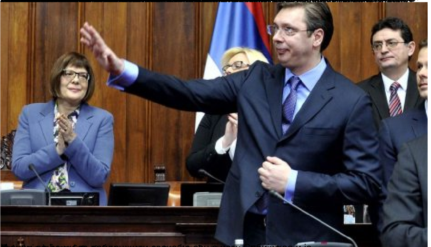
Александар Вучић на парламентарној седници у Београду, 14. децембра 2014. године.