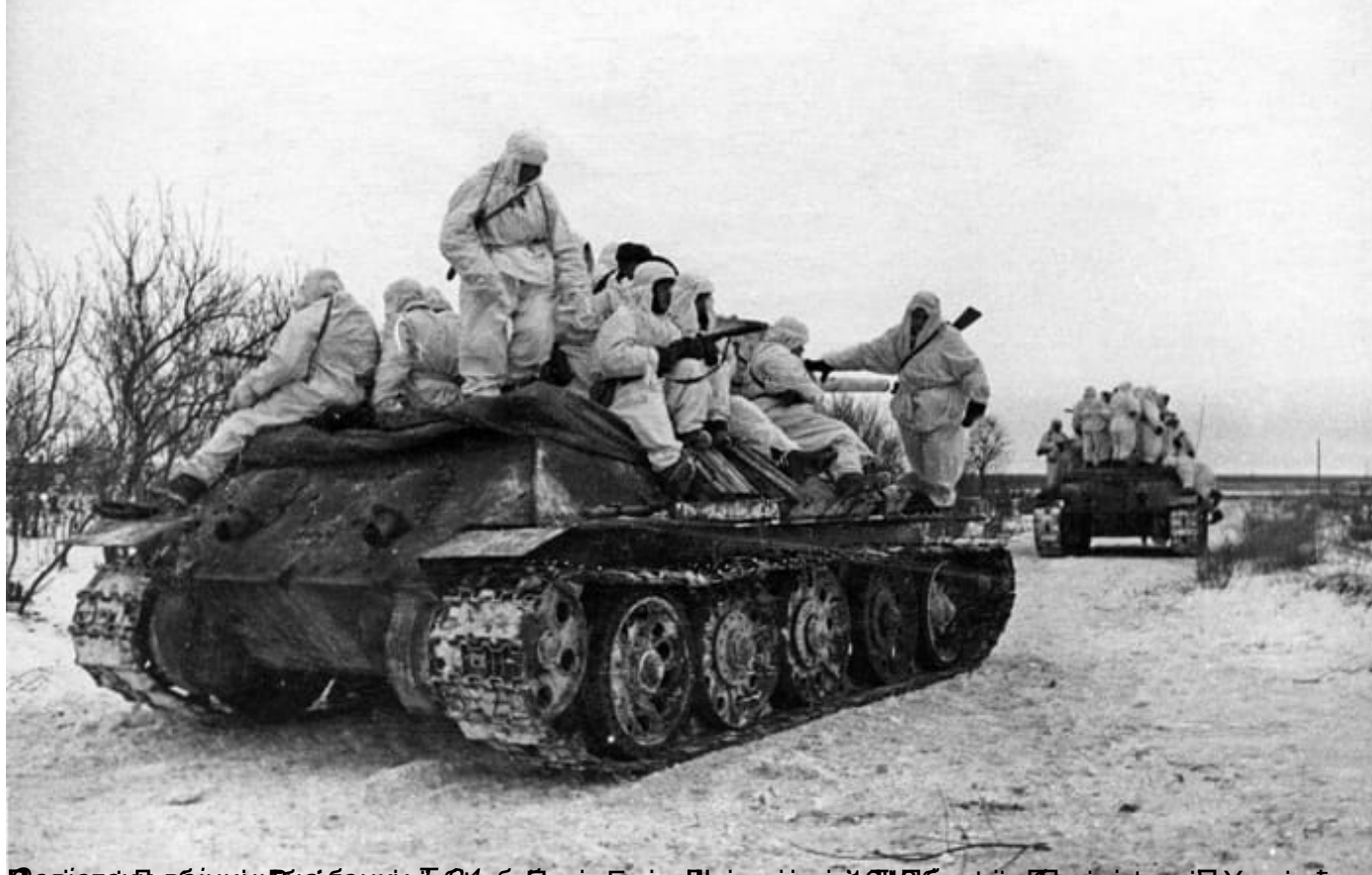
Битка за Сталинград, 1942.