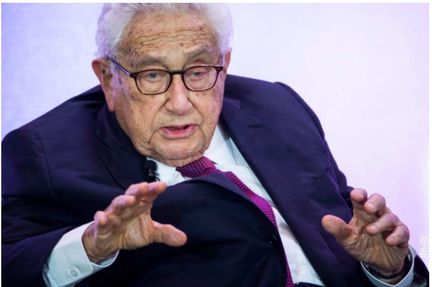
Хенри Кисинџер 2019.

На питање какав ће бити XXI век, Хенри Кисинџер је пре педесет година рекао: „Биће окрутан и бићу срећан што нећу морати да будем сведок у његовом највећем делу.“ Био је само до пола у праву. Кисинџер је и у трећој деценији 21. века и даље активан, а свет је доиста бруталан. И постаје све бруталнији. Кисинџера, који је у петак, 20. маја, напунио 99 година, с разлогом нзивају „патријархом светске дипломатије“. Он је свестан да би текући сукоб између Русије и Украјине могао да преобликује свет какав познајемо и због тога каже да би „све стране требало да почну мировне преговоре у наредна два месеца“. После тога биће касно.