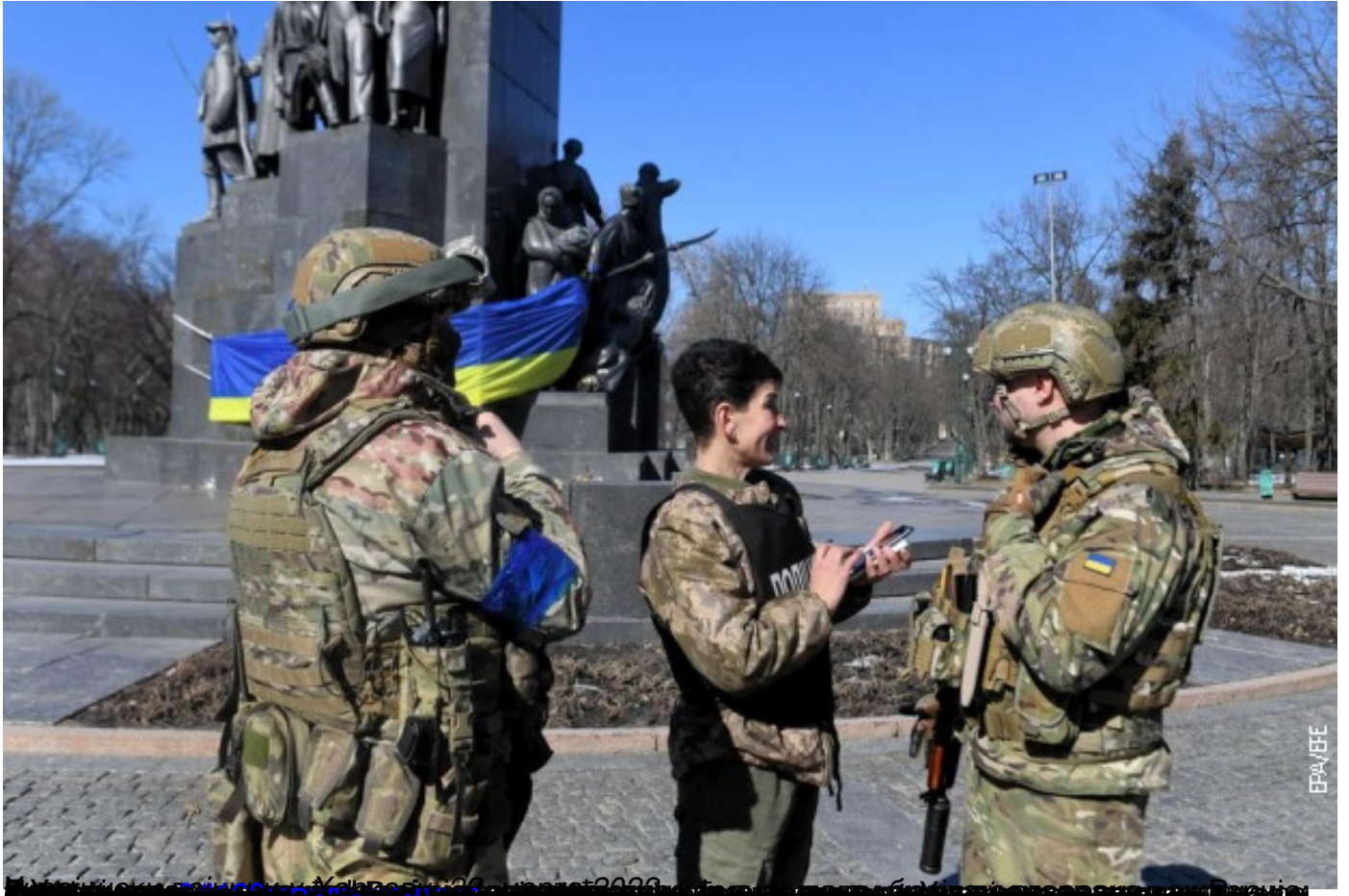
Два војника са Украјине разговарају са женом која је у војној униформи. У позадини се налази споменик у Кијеву.

Пише: Срђан Гарчевић недеља, 03 април 2022 11:08