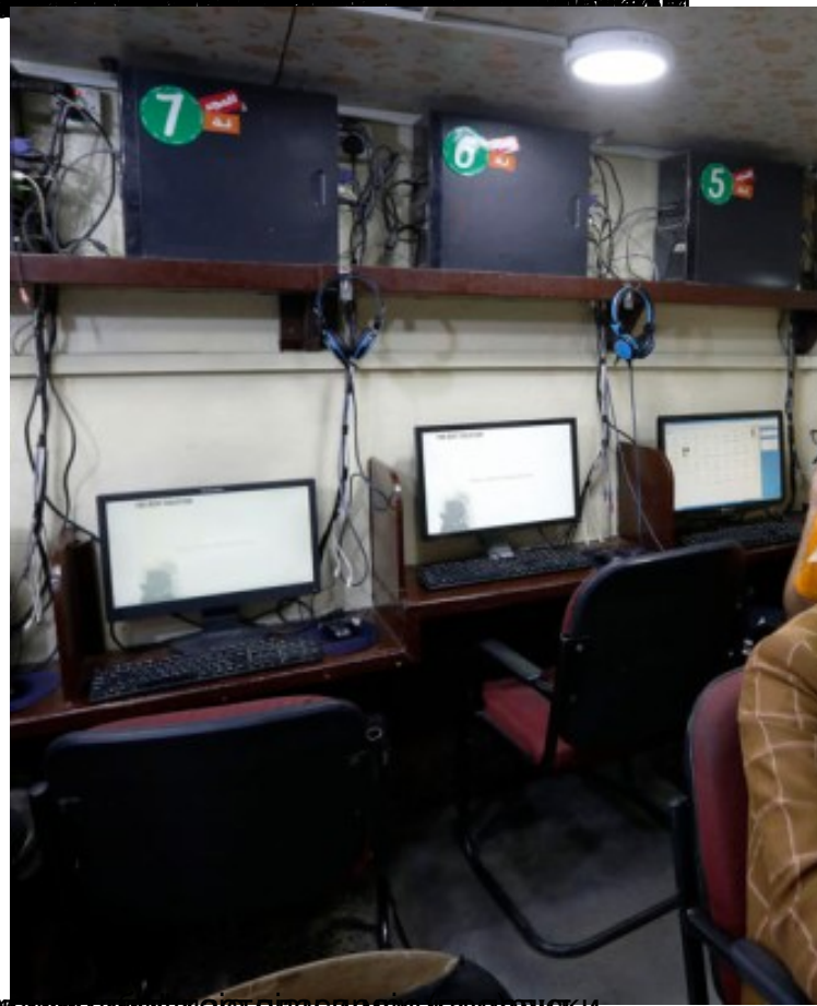
Интернет је постао бојно поље и оружје. На слици се види серверна соба са рачунарима и опремом.