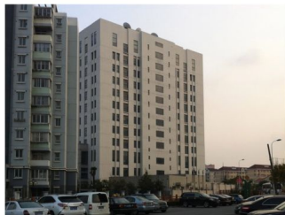
This 12-story building on the outskirts of Shanghai is the headquarters of Unit 61356 of the People's Liberation Army. China's defense ministry has denied that it is responsible for alleged digital attacks.

Покушај да се контактира двоје појединаца путем телефона и порука није био успешан. У једном случају један од њих – на чијем онлајн профилу стоји да има 28 година и да је дипломирао на факултету који је специјализован за компјутерску науку - одбио је да одговори на питања.