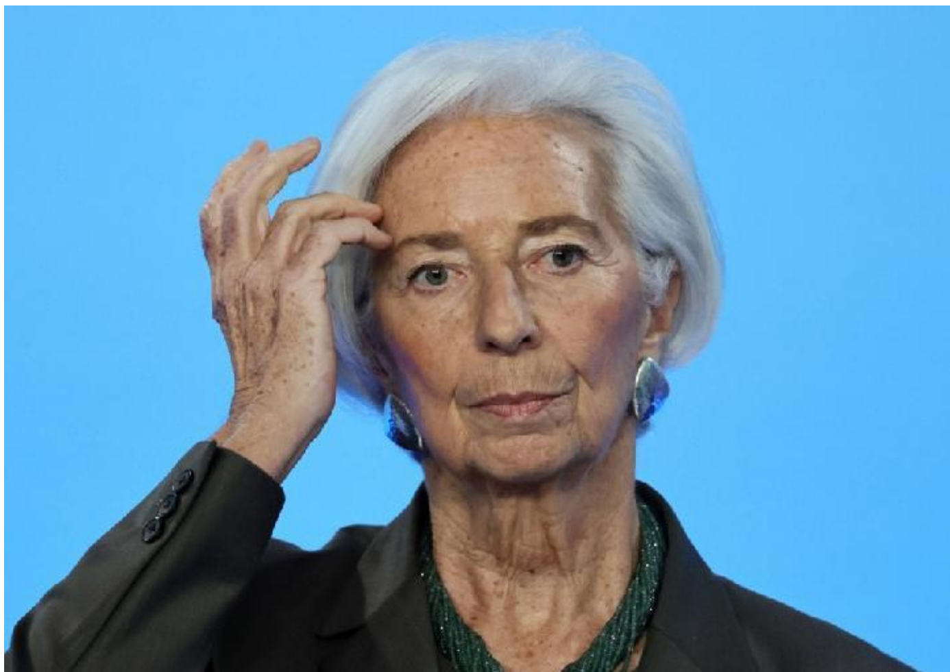
Кристин Лагард, директорка Европске централне банке

О рату на Блиском истоку, његовим економским последицама и новом пуштању оног злодуха енергетске кризе из боце, кога су после почетка рата у Украјини централни банкарши широм света једва у боцу вратили, говорила је недавно за лист „Економист“ Кристин Лагард, директорка Европске централне банке, и „лудом свету“ послала упозоравајуће поруке.