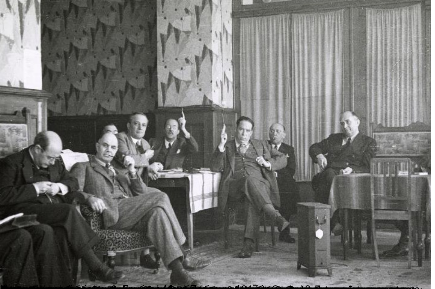
Датум: 30. Август 2025. 16:40. Место: Београд. Аутор: Бранко Милановић. Контакт: [нејасно]

Пише: Бранко Милановић субота, 30 август 2025 16:40